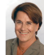
Schleswig-Holstein Ministerin für Bildung, Wissenschaft, Forschung und Kultur Ute Erdsiek-Rave