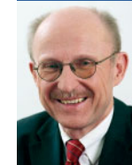
Freie Hansestadt Bremen Der Senator für Bildung und Wissenschaft Willi Lemke