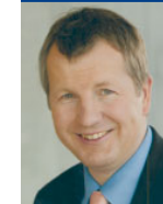
Niedersachsen Minister für Wissenschaft und Kultur Lutz Stratmann