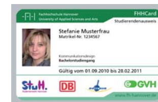
FHHCard validiert, z.B. zweites Semester